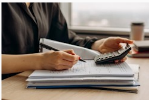
Tabela - Evidenca delovnega časa

Priloženo tabelo lahko za lastne potrebe brezplačno uporabljate in spreminjate. V kolikor želite, da vam član, ki je tabelo pripravil, tabelo prilagodi za lastne potrebe proti plačilu, ga lahko kontaktirate na GSM: 040 798 737.